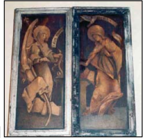
Tryptyk Wita Stwosza, przedstawiający scenę Zwiastowania - skradziony z kościoła w latach 90-tych.

Rozległa historia wiąże się również z kościołem, pw. św. Katarzyny Aleksandryjskiej, wokół którego ostatnio jest wyjątkowo głośno, gdyż odkryto zabytkowe średniowieczne polichromie oraz rzadko spotykane na śląsku sakramentarium. Prace na dzień dzisiejszy są bardzo zaawansowane, a efekty trwającej już drugi rok konserwacji zaczynają być widoczne.