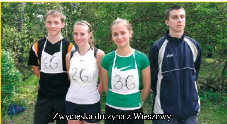
Zwycięska drużyna z Wieszowy