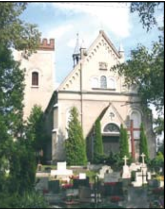
Kościół pw. św. Jana Chrzciciela

Jak podają źródła w latach '70 XVII w. do parafii w Kamieńcu należały również pobliskie wsie: Księży Las, Boniowice, Karchowice, Jaśkowice, Zawada i Wigielzów, w 1687 już tylko Łubki i Księży Las.