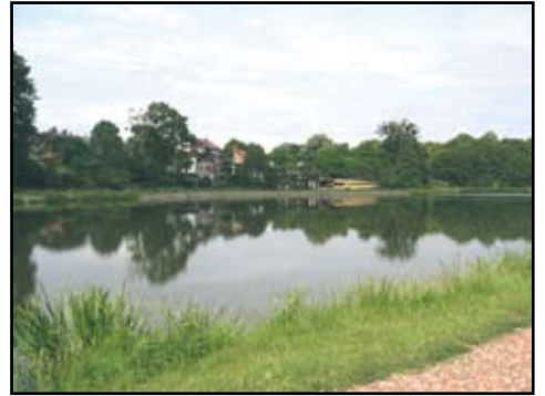
Zalew o powierzchni 3ha, znakomite miejsce do połowu ryb

Kamieniec (w 1936 r. Dramastein, w późniejszym czasie Kamin, Kammienice, Kamienetz) został założony około 1279 r. nad rzeką Dramą, na dawnym szlaku handlowym, wiodącym z Państwa Rzymskiego przez Bramę Morawską ku Morzu Bałtyckiemu. Nazwa wsi związana była z występującymi na tym terenie dużymi pokładami kamienia wapiennego, które zaowocowały powstaniem w późniejszym czasie licznych kamieniołomów. We wschodniej części wsi, na wzgórzu, odkryto: osadę obronną kultury lużyckiej (650 - 400 p.n.e), a w niej chatę, gdzie produkowano przedmioty z brązu, oraz grodzisko wczesnośredniowieczne z VII- IX w., zniszczone w 875 r. prawdopodobnie przez Świętopelka.