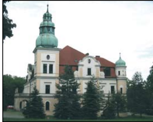
Pałac oraz „Mysia Wieża” z 1887 r., zbudowana za Strachwitzów